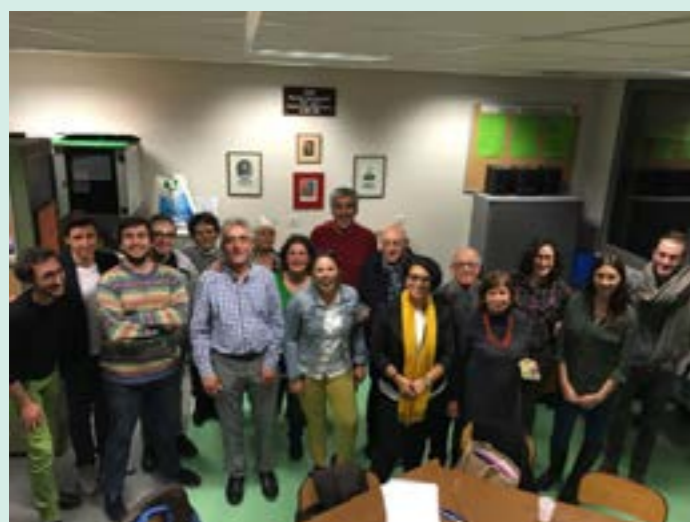
Assablée général, élection du Conseil d'administration et le bureau executif avec la création de branche jeunes

Son objectif est de promouvoir l'amitié entre les Turcs et les Français, de favoriser les liens entre les deux communautés, les deux pays, en organisant des activités et des rencontres culturelles, sociales, amicales et récréatives, telles que conférences, expositions, concerts, cours de langue turque, traductions techniques, juridiques, administratives Français-Turc.