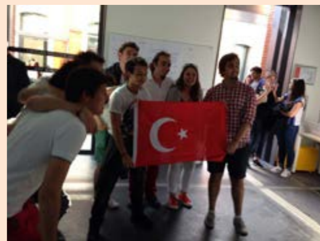
Lors de l'événement Share Your Culture les visiteurs ont élu le pole jeune de L'Association France-Turquie de Midi-Pyrénées « meilleure équipe »

La section Jeunes Franco Turcs SJFTMP est une branche de l'association France Turquie de MP et par conséquent est conforme à leurs objectifs, leur politique d'engagement et la mise en oeuvre de leurs actions. Ses bases ont été décidées lors de l'assemblée générale de 2015 par la proposition d'un groupe d'étudiants turcs à Toulouse venant de différentes régions de Turquie et étudiant dans les diverses facultés de Toulouse. La fondation d'une telle branche est apparue nécessaire, par suite de lacunes, administratives ou bureaucratiques, afin d'améliorer la situation des jeunes. Étant la première organisation "jeunes Turcs" à Toulouse, notre entraide s'étend à toute personne voulant apprendre la culture turque, et désirant participer à nos actions dans les domaines culturels et environnemental. La mobilisation pour l'environnement ne dépend pas du communautarisme mais c'est une obligation pour chaque individu. Aujourd'hui, notre monde est confronté à des désastres écologiques à cause de l'action de l'homme depuis la découverte de la domestication et indirectement de l'agriculture, à ce stade notre branche veut promouvoir la mobilisation pour l'environnement tout en étant conforme aux dispositions de l'AFTMP, sans négliger les actions concernant l'entraide et la culture.